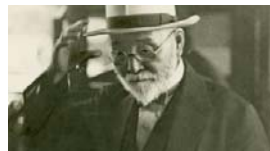
究極のばらまき「ヘリコプターマネー」期待相場の末路 (8/3 7:00)AERA