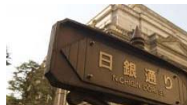
預金が下ろせなくなる？ 国の 借金1000兆円を国民… (10/31 7:00)dot.