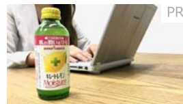
才色兼備が教える、忙しいあなたにぴったりな美容ケア【by.S】 ホッカサッポロ フード&ビバレッジ