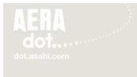
慶大准教授「安倍氏の掲げる リフレ政策は邪道」 (11/28 16:00)週刊朝日