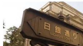
預金が下ろせなくなる？ 国の借金1000兆円を国民... (10/31 7:00)dot.