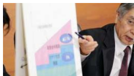
【2017年大予測】井上智洋「アベノミクスと財政再...」 (1/13 7:00)AERA