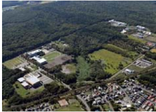
日本ハム新球場候補地のきたひろしま総合運動公園周辺=北海道北広島市で2017年9月