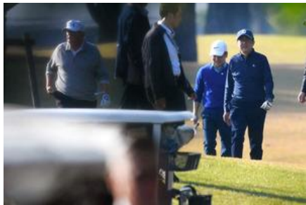
トランプ米大統領（左端）とゴルフをする安倍晋三首相（右端）= 2017年11月5日、埼玉県川越市の霞ヶ関カンツリー倶楽部