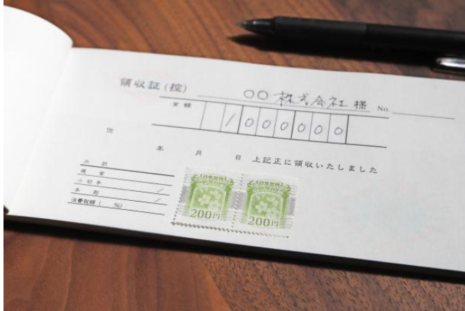
収入印紙

納税者からしてみれば税金はどれも不合理なものです。中でも課税の根拠が見えづらく不合理・不透明だと言われる「印紙税」。ルーティンワークで送っていたお礼状が印紙税対象の文書だと税務調査で指摘され、印紙税と過怠税合わせて3千万円払ってねと指摘される——といった事態は現実起きています。そもそも印紙税は必要なものなのでしょうか。(ライター・拝田梓)