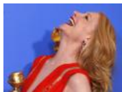
レッドカーペットの女優たち