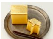
新年に華やぎのある手土産