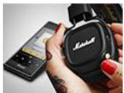
マーシャル感満点のイヤホン