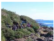
濟州島のオルトレッキング