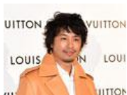
ヴィトンの新作を着て登場