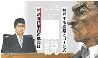
ゴーン前会長と特捜、主張鋭く対立 事件の最新の争点は