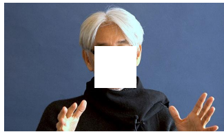
ローラ発言にクルーニー重ね 坂本龍一さんのカナリア論