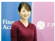
FPとして女性を応援したい