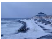
書きたいのは「普通の人」