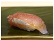
マッキー牧元の18年グルメ論