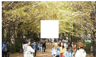
イチョウ並木、黄金色のトンネルに 東京で見ごろ