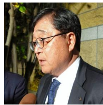
逮捕の報に「信じられない」