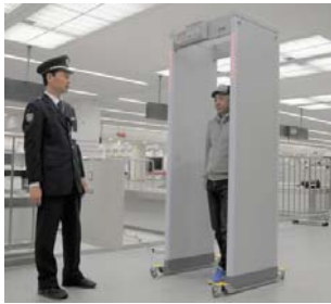
名古屋税関が設置したゲート型金属探知機 = 常滑市の中部空港で

急増する金塊密輸を水際で阻止しようと、名古屋税関は中部空港（愛知県常滑市）に、入国者が通過するだけで金塊を隠し持っていないか調べられるゲート型金属探知機を設置した。時間短縮できて検査対象者を増やすことも見込めるといい、同税関は「海外旅行者が増加するゴールデンウィークを前に、厳格かつスムーズな通関業務を実現したい」としている。【竹田直人】