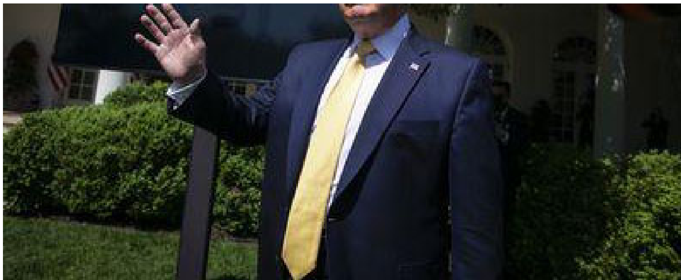
トランプ大統領

トランプ氏は大統領選出馬への野望を膨らませる中で、米国の経済界の納税は不十分だと非難し始めた。この問題に初めて言及した2015年のツイートは、「アマゾンが公正に納税せざるを得なかったら、同社株は急落し、紙袋のようにぼろぼろになるだろう」としていた。その後もトランプ氏は少なくとも12回、ほとんど納税していないとしてアマゾンに非難するツイートを投稿している。