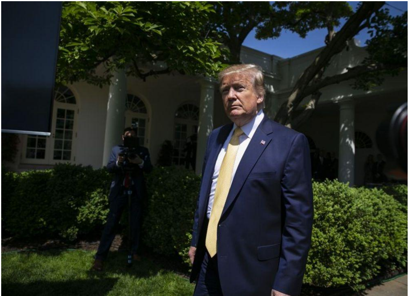
トランプ大統領

トランプ米大統領はアマゾン・ドット・コムなどの大企業が納税義務を怠っていると非難しているが、トランプ氏自身も大統領就任前に少なくとも10年にわたり、アマゾンなどが納税額を減らすために用いた税控除の一部を利用して連邦の納税額がゼロになるか、わずかな納税額にとどめていたことが分かった。