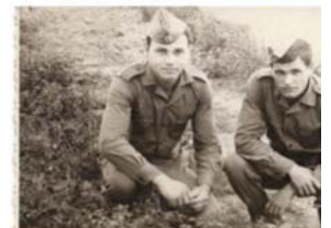
世界の1/4を植民地化しなぜ日本だけは侵略しなかつたのか