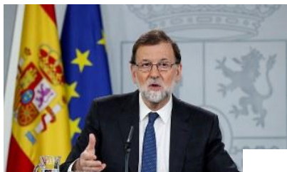
スペインのラホイ首相