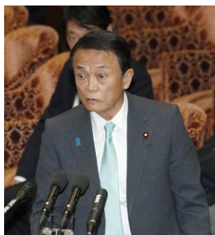
麻生太郎財務相

「鈍感すぎる。浮世離れているんじゃないですか」—— 13日の衆院予算委で、立憲民主の長妻昭議員が声を荒らげた。佐川宣寿国税庁長官をめぐる麻生太郎財務相の国民をナメ切った答弁のことで。昨秋から立て続けに財務省から記録が見つかり、佐川長官のウソ答弁がハッキリしても、安倍政権は「適材適所」だとしてかばい続けている。16日には確定申告が始まる。麻生大臣の“浮世離れ”答弁が納税者の怒りの火に油を注いだのは間違いない。