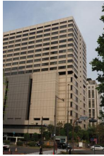
東京地裁および東京高裁が入る庁舎＝東京都千代田区で2019年5月10日

組織再編に伴う借り入れを巡って国税当局から受けた追徴課税を不服として、大手レコード会社「ユニバーサルミュージック」（東京都渋谷区）が、処分取り消しを求めた訴訟で、東京地裁は27日、同社の請求を認め、法人税約51億2300万円と過少申告加算税約7億1500万円の課税処分を取り消した。