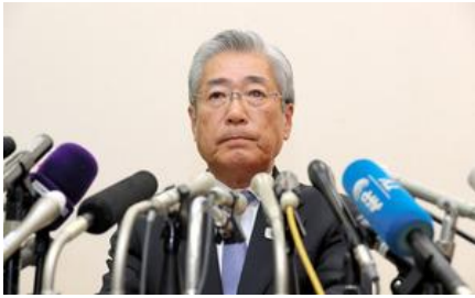
JOCの竹田恒和会長 = 2019年1月15日、東京都渋谷区

日本オリンピック委員会（JOC）の竹田恒和会長（71）が、18年に及んだトップの座から身をひかざるを得ない状況に追い込まれた。心血を注いだ2020年東京五輪 招致における疑惑がきっかけとなり、国内外で批判が高まっていた。