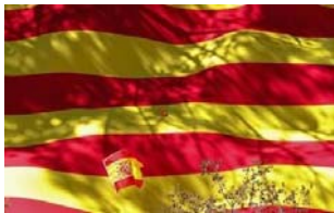
6月27日、今年上半年は、南欧諸国の国債の値動きにかつてないほどの格差が見られた。スペインがユーロ圏の主要国債で最も堅調だったのに対して、イタリアは最悪の相場展開になった。写真は2017年10月、パルセロナで撮影

[ロンドン 27日 ロイター] - 今年上半年は、南欧諸国の国債の値動きにかつてないほどの格差が見られた。スペインがユーロ圏の主要国債で最も堅調だったのに対して、イタリアは最悪の相場展開になった。