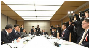
経済財政諮問会議で発言する安倍晋三首相(左から2人目) =首相官邸で2019年1月30日午後5時8分

内閣府は30日に開いた政府の経済財政諮問会議に、中長期の経済財政に関する試算を提出した。財政健全化の指標である国と地方の基礎的財政収支(プライマリーバランス=PB)について、2026年度に黒字化すると試算し、昨年7月に示した前回見通しから1年前倒しした。ただ、高い経済成長を前提にしており、実現するかは不透明だ。