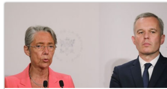
フランス、同国発の航空便利用客に環境税課税へ 最大で2200円