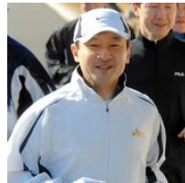
皇太子さま、メダリストと伴走