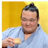
稀勢の里、現役続行明言