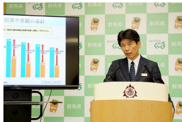
中期財政見通しについて説明する山本一太知事 = 18日、県庁

群馬県は18日、今後、毎年約200億円の財源不足を見込む「中期財政見通し」（令和元年度～6年度）を発表した。山本一太知事は会見で「行財政改革をしなければ、借金などで対応せざるを得なくなることは火を見るよりも明らかだ」と述べ、財政健全化に向けた行財政改革を加速させる考えを示した。