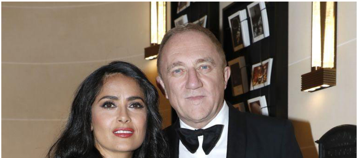
サルマ・ハエック (Salma Hayek) 、フランソワ・アンリ・ピノー (Francois-Henri Pinault)