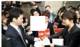
国会でも#MeToo 野党議員、セクハラ疑惑に抗議