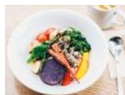
鎌倉の庭で名物野菜ランチ