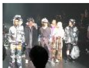
モデル探しは深夜の渋谷