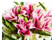
なぜ？ 楽しみじゃない結婚式