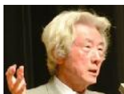
総裁3選「難しいだろうな」