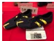
「陸王」5代目モデルの展示