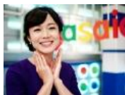
有働由美子さんの「魅力」