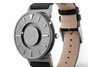
さわって堪能できる腕時計