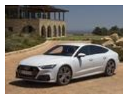
新型A7スポーツバック試乗