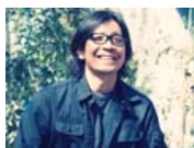
あの頃のアメリカ物語