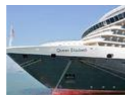
クイーン・エリザベスの船旅