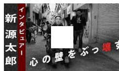
10年後には心不全、でも声出る限り 悲しき壁ぶっ壊す