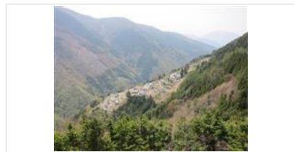
長野県飯田市の遠山郷のように集落と里山が接した場所では、間伐などの森林整備が欠かせない