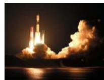
H2Bロケット打ち上げ成功