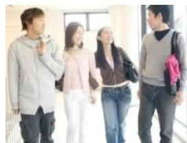
自分の好きな道へ進めますように！

まず、 全体の平均額は824万円 となっており、平成24年の前回調査よりもややアップしています。