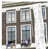
コーヒーはいかがですか