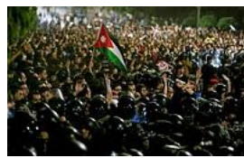
2日、ヨルダンの首都アンマンにある首相府付近で、税制改革法案などに抗議するデモ隊

【エルサレム時事】ヨルダンで政府が進める緊縮財政政策に反対する抗議デモが拡大している。天然資源に恵まれず、海外からの経済支援に大きく依存する一方、「中東安定の要」と目されるヨルダンの不安定化は地域全体に影響が及ぶ恐れがあり、デモの行方が注目されている。