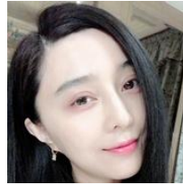
姿消して初...やせた？