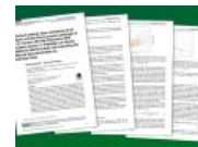
福島被曝「重要論文の誤り」