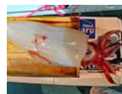
イカの水や墨の噴射にめげず