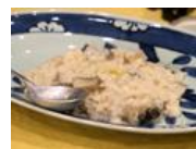
冷凍庫に入りきらない魚で