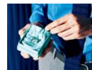
バレンタインの意識調査