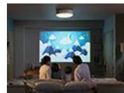
寝室を映画館にしよう！