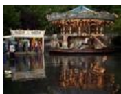
パリはライカで撮りたい