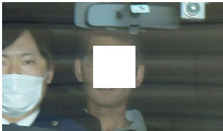
「元職員は喜怒哀楽の哀ない」同僚語る 介護施設死傷