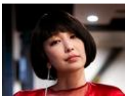
中島美嘉「雪の華」15周年