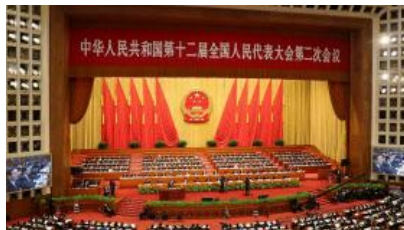
中国共産党は地方の幹部の業績評価を、主に各地方の成長に基づいて実施しているため、統計がゆがめられやすい

論文では08年から16年の間を分析対象としており、18年の国内総生産（GDP）成長や中国経済の規模の推計は含まれていない。だが、論文で示している16年の推計と同程度に、18年のGDPが過大評価されていたとすれば、18年の実際のGDPは公式統計の90兆元（約1500兆円）という数字を10.8兆元下回ることを示唆している。