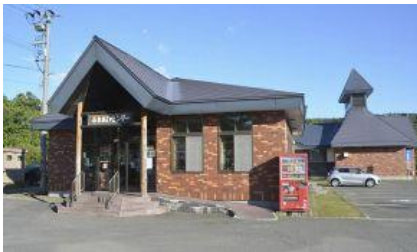
温泉利用型健康増進施設に認定され、税控除の利用者が全国一になっている豊富温泉ふれあいセンター

【豊富】道内で唯一、温泉利用料などが税控除の対象となっている宗谷管内豊富町営の豊富温泉ふれあいセンターを利用して、この1年間で、税控除を受けた人は計181人となり、全国22カ所の認定施設で最多となった。町は温泉を中心にしたヘルスツーリズムを進める方針。