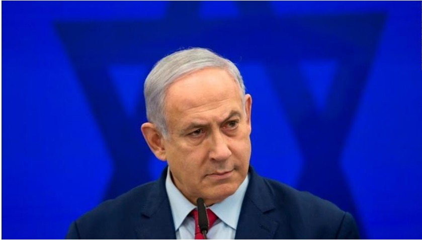
ネタニヤフ首相が組閣を断念したことがわかった

エルサレム(CNN) イスラエルのネタニヤフ首相は21日、やり直し総選挙の結果を受けた組閣を断念するとの意向を明らかにした。