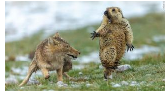
写真特集:「野生動物写真家大賞」、各部門の受賞作を見る 10/18