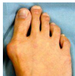
「ヒールが悪化要因に」