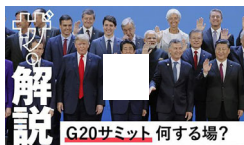
G20って何するの 過去最大の首脳級会合、三つの焦点