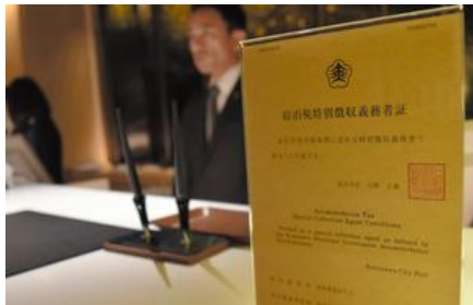
ホテルのフロントに置く予定の「宿泊税特別徴収義務者証」= 2019年3月、金沢市香林坊2丁目