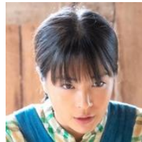
幼少期を演じるのは…