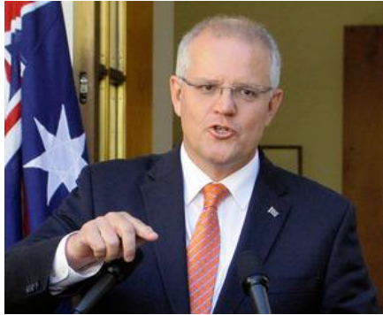
オーストラリアのモリソン首相

オーストラリアのモリソン首相は11日、総選挙を5月18日に実施すると発表した。モリソン氏が率いる保守連合（自由党、国民党）と最大野党の労働党の争いとなる。世論調査では与党の劣勢が続き、2013年以来、6年ぶりの政権交代の可能性がある。