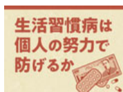
「病気予防」で医療費減る？