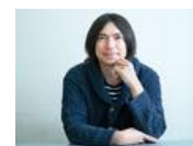
ふかわりょうのポルトガル