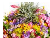
自分のことは後回しだった母