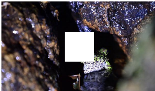
まるで鳥の鳴き声 「日本一美しい」奄美のカエルの美声