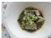
春が旬！サワラを蒸し煮で