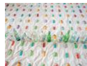
最も正体不明だった観光地