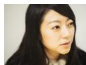
仕事の悩み 気鋭の学者が解決