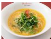
気になる「レモンらぁ麺」