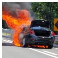
B MW出火、韓国で相次ぐ