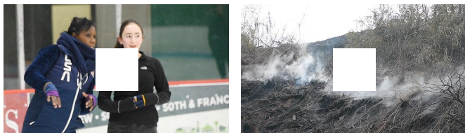
フィギュア女子、4回転時代へ 先駆者ボナリーに聞く 「ボタ山」、2年間燃え続ける 消す方法は見つからず