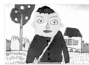
識者が回答「悩みのるつぼ」