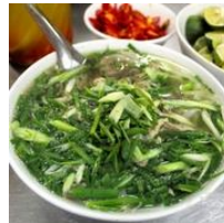
本場のフォー、池袋出店