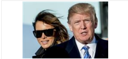
トランプ米大統領 = 3日