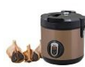
自家製黒にんにく製マシンの