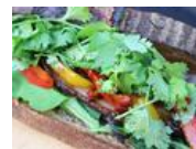
元寿司職人のパン屋に新店