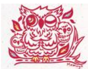
フクロウたちに癒やされた