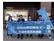
発達障害児支援は親への支援