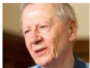
ギデンズが語る欧州