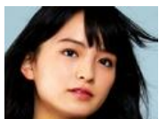
触れたいのは未来