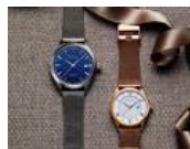
特別な人と贈り合いたい時計