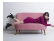
芹澤優 声優業の挫折と喜び