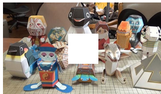
薄い紙を落としてポン、立体ペンギン化 斬新なからくり