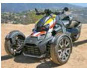
乗り味は？ 注目の三輪自動車