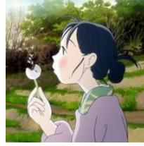
この世界で異例のロングラン