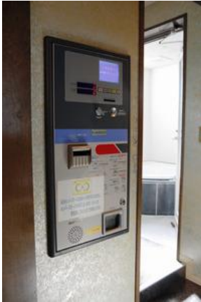
ラブホテル客室内の自動精算機。経営者の男性は宿泊税に対応するにはシステム変更が必要という＝金沢市内