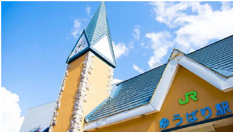
夕張市にあるJR北海道・ゆうばり駅の駅舎

いいね! シェア 159 ツイート 一覧 コメント 4 G+ B! 印刷 A A