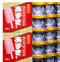
どっちが硬い？ =提供