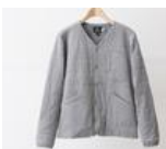
着替えたくないほどの快適さ