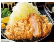
わさび醤油で食べる とんかつ