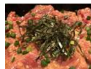
ご飯を埋め尽くすマングロ赤身