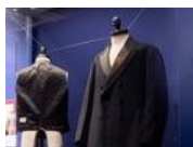
アメリカの歴史と歩んだ服