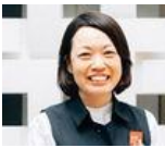
代官山 鳥屋書店員の仕事