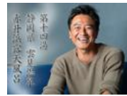
まさかの「不倫旅行」写真集