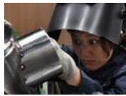
1ミリの誤差でも不良品