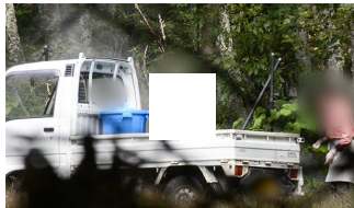
生ごみ放置、清流の山中に異臭 記者が目撃した投棄現場