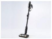
これは便利！曲がる掃除機