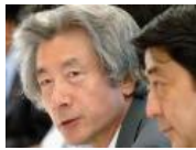
小泉純一郎から中国への手紙