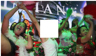
ジュリアナ東京が大阪・キタで復活 荒木師匠も舞い踊る