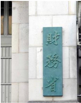
麻生太郎財務相の自筆の字があしらわれた財務省の看板 = 2016年6月5日、東京都千代田区

米国で注目されるMMT（現代金融理論）など 財政規律 の軽視につながる議論をめぐり、財務省 が反対するデータを集めた資料を 財政制度等審議会 の分科会に出した。資料は反論データに異例の分量を割いている。来年度予算へ向けた議論をスタートするにあたって、国の借金が膨らむことへの楽観論に反論し、財政健全化への理解を広げたい考えだ。