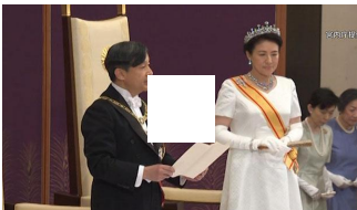
新天皇陛下「国民の象徴の責務果たす」 初のおことば