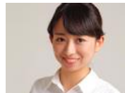
大切なのは仕事を愛すること