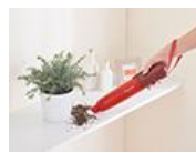
サツと使える極細の掃除機