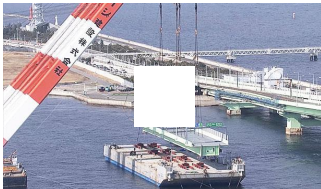
台風で破損した関空の連絡橋、新しい橋桁の架設始まる