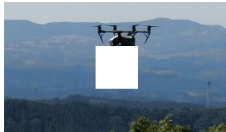
阿蘇の絶景を眼下に飛ばし放題「ドローン手形」始まる