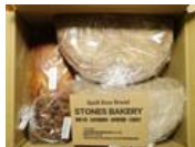
通販もうれしい大阪のパン屋