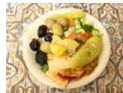
いま、チュニジアにいます