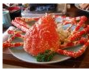
南伊豆町の桜と駿河湾の恵み