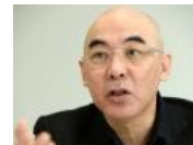
百田尚樹に欠落している認識