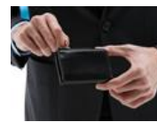
新年に買い替えたい財布特集