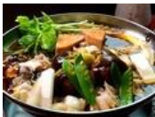
江戸っ子にはたまらない