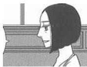
「逃げ恥」が言いたいこと