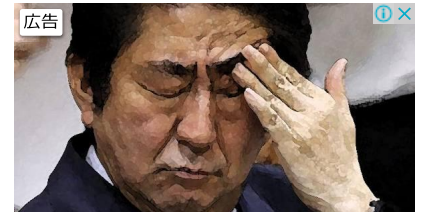
安倍おろしを仕掛ける黒幕の正体