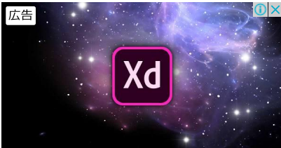
Adobe XDが15分でわかる無料「スターターキット」

米サンフランシスコではホームレス問題の解決に向けた資金を捻出するため、大手企業に新たな税を課す法案が11月7日、住民投票により可決された。この法案の正式名称は「Proposition C (Prop C)」だが、フィナンシャル・タイムズ等の大手メディアは「ホームレス税」との呼称で、このニュースを報じている。