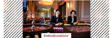
いま注目の若手起業家2人が韓国パラダイスシティを訪れる理由とは？