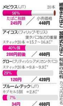
紙巻きたばこと加熱式たばこの税額の比較

急速に普及が進む加熱式たばこについて、政府は増税する方向で検討に入った。従来の紙巻きたばこより税金が割安なため、同水準にそろえて税収の落ち込みを防ぐ。今後、与党や関係業界との協議を本格化させ、年末にまとめる来年度の 税制改正大綱 に盛り込む方針。増税の程度によっては、商品の価格にも影響を与える可能性がある。