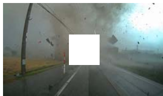
目の前を飛ぶ屋根、車載カメラが捉えた突風 滋賀・米原