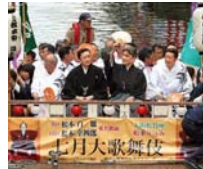
【動画】大阪の夏の風物詩