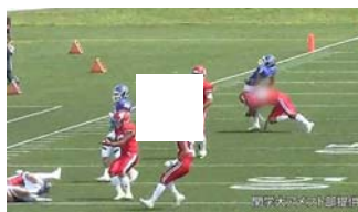
元選手の記者が抱いた違和感 反則時の日大ベンチの視線