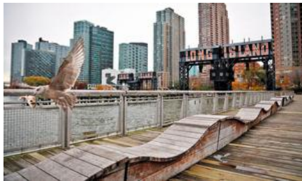
アマゾンが13日、新たな本社を置く場所として発表した2カ所のうちの一つ、ニューヨーク市のロングアイランドシティ地区=A P

ネット通販世界最大手の米アマゾン（本社・シアトル）は13日、「第2の本社」を置く場所について、ニューヨークとバージニア州アーリントンに決めたと発表した。238地域が激しい誘致合戦を繰り広げてきたが、結局、全米有数の都市が選ばれ、米メディアの間では批判も出ている。