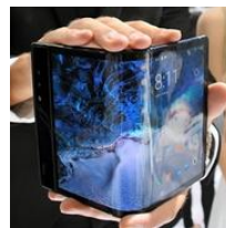
折り曲げるとスマホに