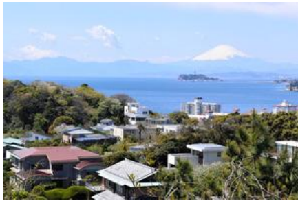
海に近い自然豊かな住宅街があることで知られる逗子市。右奥は富士山