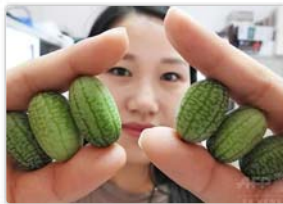
どうやって食べる？ 新鮮な「親指スイカ」の季節