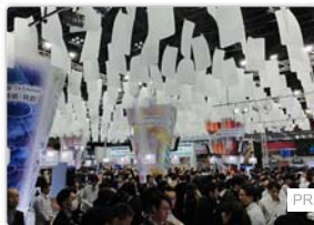
レジがない、並ぶ必要もない、新しいショッピング