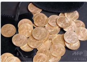
空き家から金貨ざくざく600枚…仏で作業員が発見 1000万円超相当か