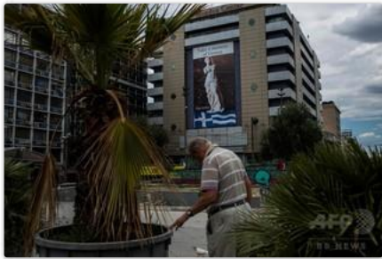
ギリシャの首都アテネ中心部のオモニア広場で、鉢植えのヤシの木の前に立つ男性 (2018年6月21日撮影)。

2018年6月22日 13:15 発信地: ルクセンブルク/ルクセンブルク [ギリシャ, ルクセンブルク, ヨーロッパ]