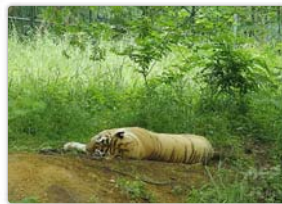
客がトラに投石か 北京野生動物園