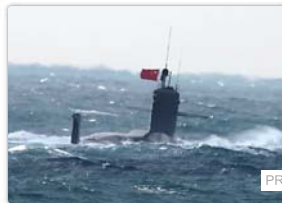
中国ネット民騒然 尖閣沖「原潜浮上」は故意か失態か