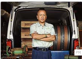
「失敗した、壊した、怒鳴られた、それでも諦めなかった」熱き職人が語るプロの流儀